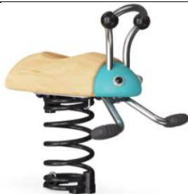
Loulou le pou Réf. : NRO112

Intérêt : Jeu adapté aux plus petits, en bois et rappelant la nature