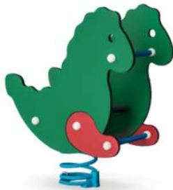
Le dragon Réf. : M113

Intérêt : Jeu adapté aux plus petits, coloré et développant l'imaginaire