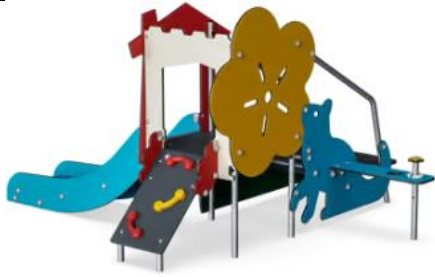
Château des tout-petits + mur d'escalade Réf. : MSC5422

Intérêt : Jeu adapté aux plus petits et coloré pour le rendre attrayant. Le toboggan et le petit mur d'escalade