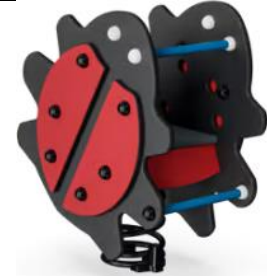
La coccinelle Réf. : M168

Intérêt : Jeu adapté aux plus petits, coloré et développant l'imaginaire