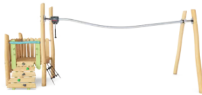
Combinaison Robinia Réf. : NRO1027

Intérêt : Jeu adapté aux plus petits, coloré et développant l'imaginaire