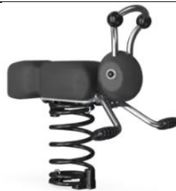
Lili la fourmi Réf. : NRO119

Intérêt : Jeu adapté aux plus petits, en bois et rappelant la nature