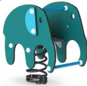
Le mammoth Réf. : M123

Intérêt : Jeu adapté aux plus petits et coloré pour le rendre attrayant. Le toboggan et le petit mur d'escalade