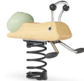
Margot l'escargot Réf. : NRO115

Intérêt : Jeu adapté aux enfants à partir de 6 ans. La tyrolienne fait l'unanimité et s'intégrerait bien dans l'environnement sportif