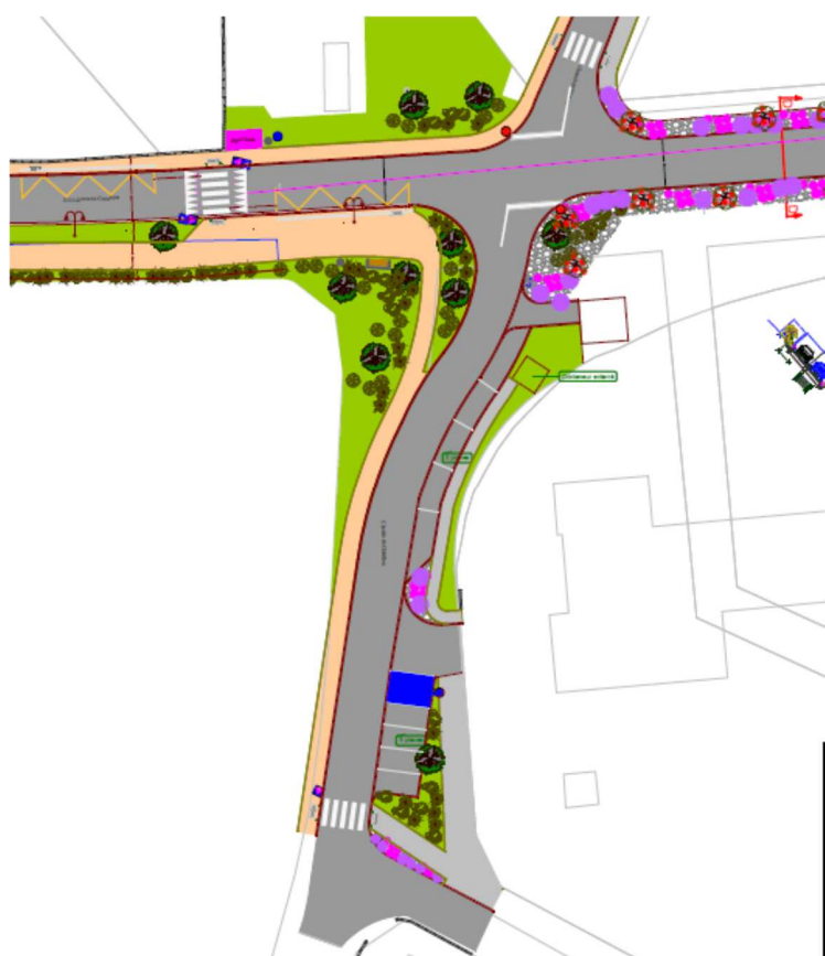
Carrefour Route de Clansayes / Gendarmerie